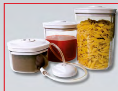
Kit 3 barattoli + 1 tubo (vers. esterna)