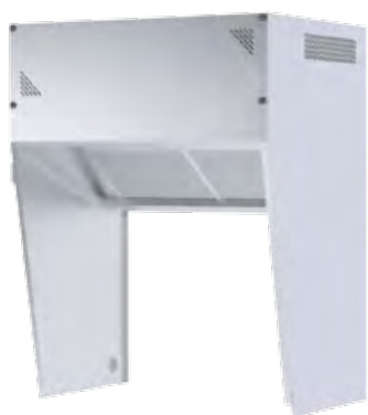
Cappa sospesa a parete

La cappa a condensazione è disponibile con un modello sospeso a parete e altri 3 modelli con basi di appoggio. Per ogni modello di cappa sono disponibili tre dimensioni: 120, 140 e 160 cm