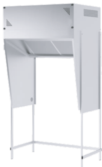
Cappa su base senza top e ripiano sotto