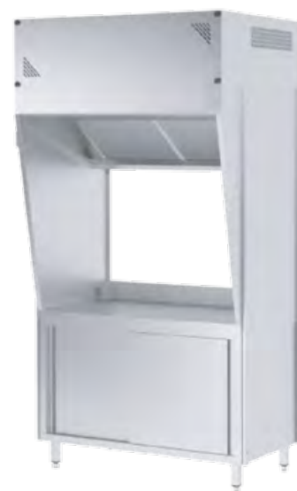
Cappa su base con top e armadiata