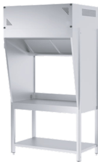
Cappa su base con top e ripiano sotto